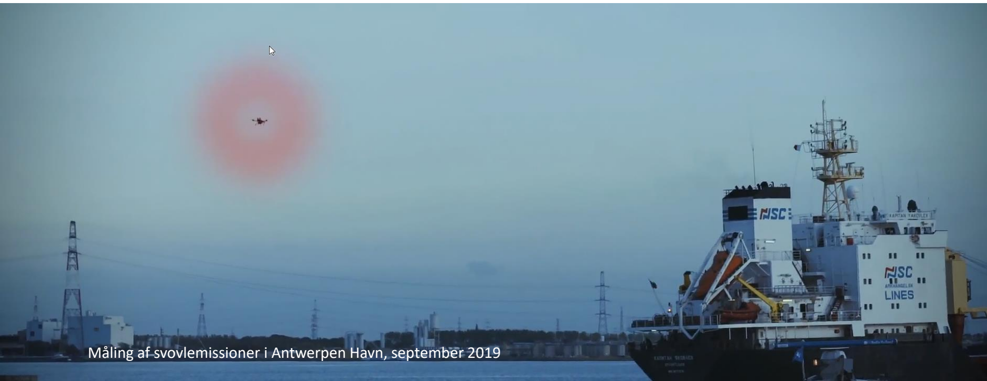
Måling af svovlemissioner i Antwerpen Havn, september 2019

Bettina Knudsen, CMO/COO +45 28 14 59 33 bettina@explicit.dk